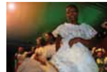
Fiesta de Palo Ana Costa